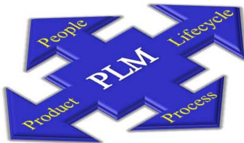
Figure 1: Expansion et évolution du PLM

La plupart des industriels ayant investi dans le PLM ont atteint le premier objectif de leurs mises en œuvre PLM : le contrôle de leurs données produits. Mais ils sont allés plus loin, et à présent ils sont en train de développer une base de données unique et fiable pour les données produits que les fabricants avaient imaginé dans les années 90. À mesure que les mises en œuvre PLM sont devenues plus matures, les industriels ont exploité leurs principales fonctionnalités et étendu le PLM à de nouvelles sources de valeur. La portée du PLM a été élargie pour couvrir plus d'intervenants, plus d'étapes du cycle de vie du produit et plus d'aspects de ce dernier (Figure 1). La solution a également évolué pour prendre en charge un plus grand nombre de processus d'entreprise tels que la conformité des produits et la gestion du service après-vente. Parallèlement, les informations contenues dans le PLM ont évolué vers une vision nettement plus riche du produit, incluant désormais fréquemment des informations commerciales en plus des spécifications techniques. Cette évolution a considérablement accru l'intérêt potentiel d'une exploitation de ces informations dans le but de prendre de meilleures décisions « business »