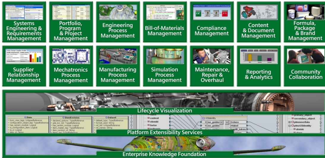
Figura 2: Estructura funcional de Teamcenter

Los párrafos siguientes describen brevemente los 17 componentes de la plataforma unificada Teamcenter actual.