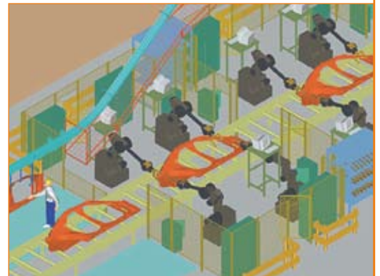
FactoryCAD-Modelle können im SDX-Format von Siemens PLM Software in diskrete ereignisorientierte Simulationsprogramme übernommen werden.