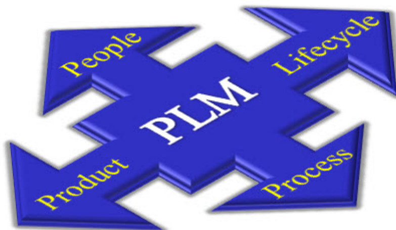
Abbildung 1: PLM – Wachstum und Entwicklung

Die meisten Hersteller, die in PLM investiert haben, konnten ihr erstes mit der PLM-Einführung verfolgtes Ziel erreichen, nämlich die umfassende Kontrolle über ihre Produktdaten. Jetzt bauen sie auf das bisher Erreichte auf und arbeiten an einer einzigen Quelle für korrekte Produktdaten, von der Hersteller schon in den späten 1990er Jahren geträumt haben. Nach dem Reifeprozess ihrer PLM-Einführungen haben Hersteller die Kernfunktionen genutzt und neue Quellen wertvoller Informationen für PLM erschlossen. Der Umfang von PLM wurde erweitert und umfasst jetzt mehr Personen, mehr Bestandteile des Produktlebenszyklus und mehr Aspekte des Produkts (Abbildung 1). Außerdem unterstützt die Lösung inzwischen mehr Geschäftsprozesse wie Produktkonformität und Serviceverwaltung. Gleichzeitig wurde auch die Fülle der in PLM zur Verfügung stehenden Daten erweitert, so dass jetzt ein sehr viel umfassenderer Blick auf das Produkt möglich ist. So finden sich dort jetzt zusätzlich zu den technischen Daten häufig auch kaufmännische Informationen. Diese Entwicklung hat den Nutzen der Auswertung dieser Informationen für das Treffen besserer Geschäftsentscheidungen erheblich gesteigert.